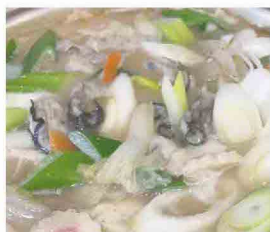
こちらが松岡水産さん から届いた沢山の牡蠣! 体が芯からあったまる 牡蠣鍋へ大変身しました。 食べることに夢中で...食事中 の写真を取り忘れてしまいました...