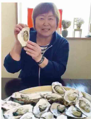
2年前に皆さんに来て いただいて種付けした 牡蠣ができました。 食べてください〜♪