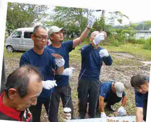
ホタテ貝に小さな穴を開け、一個ずつ針金に吊るして、牡蠣の養殖に必要な道具を作りました。