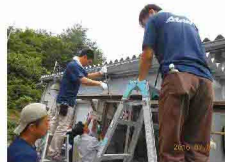
2016年当時、まだ整備が行き届いていない敷地・仮設住宅がありました。みんなで水はけ用の砂利を引いたり、穴を掘ってパイプを通したりしました。