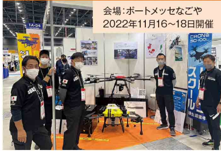
会場:ポートメッセなごや 2022年11月16~18日開催

日本最大級の異業種交流展示会「メッセナゴヤ」。株式会社DSA様の一角をお借りし、メイビが開発した運搬用ドローンを展示させていただきました。