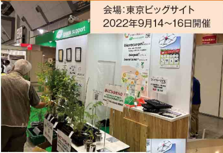
会場:東京ビッグサイト 2022年9月14~16日開催

地球環境に優しい苗木ポット(生分解性ピオポット)を扱っている、株式会社グリーンサポート様とブース出展させていただきました。苗木運搬作業などにドローンが活用できます!