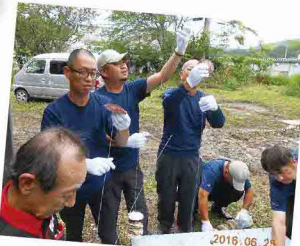
ホタテ貝に小さな穴を開け、一個ずつ針金に吊るして、牡蠣の養殖に必要な道具を作りました。