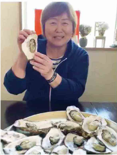
2年前に皆さんに来て いただいて種付けした 牡蠣ができました。 食べてください〜♪