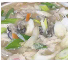
こちらが松岡水産さん から届いた沢山の牡蠣! 体が芯からあつたまる 牡蠣鍋へ大変身しました。 食べることに夢中で...食事中 の写真を取り忘れてしまいました...