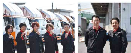
ホームページ用に撮影を行った写真の一部です。

7月にメイビの採用専用のホームページが完成します。現在、本紙制作と平行して制作を進めています。ドライバー達の生き生きとした表情を紹介していきますので、どうぞ楽しみにお待ちください!