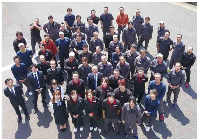
この日は、年に3回ある社員全員が集まる1日です。毎年恒例の集合写真を撮影しました。今年はドローンを使って撮影してもらいました!

4月28日、今年で5回目となる「安全推進決起大会」を開催しました!年度初めに行っている大切な行事の一つとして、今年も各班ごとの活動報告や、新年度への目標や決意表明を行ないました。大会の後半では、ドライブレコーダーの映像を使った安全運転の研修を受けました。新年度も安全な1年になるよう、気持ちを新たにスタートします!