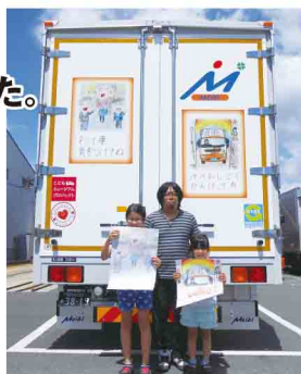
こどもミュージアムトラックが納車された時に撮影した一枚。この写真を娘さんは机に貼っています。

メイビへ入社して10年になります。昨年、娘の描いたトラックにラッピングした「こどもミュージアムトラック」を運転し、中日新聞の取材を受けて掲載されました。それを見た親戚からメールが来たり、娘達も喜んでいました! プライベートでは、私は体を動かすことが好きなので、冬場は娘達とスノーボードへ行ったりします。子供が大きくなれば自分たちで遊ぶようになってちょうし、それまでは自分も一緒に体を動かして遊んでやれるようにしたいと思っています。