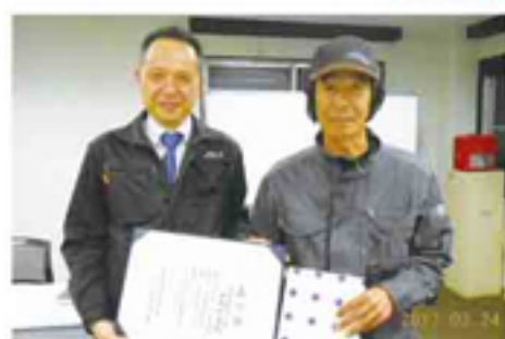
3月に優良運転者表彰状をもらいました。