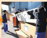
自分が何をやらたいのか、様子を伺いながらモジモジ...