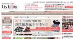
ブログでは人柄を伝えるようにしています。ネットこそ日本人から買うのが大切な要素だと思っています。

人気ブランドの小物、洋服のオンラインリサイクルショップ Lis blanc (リ・ブラン) http://www.brand-lisblanc.com