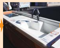
設置したキッチンの値段(128万円)を見てビックリ!!