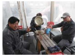
スタッフにも大好評で