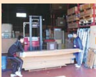
「声を掛け合いながらゆっくりにね〜」