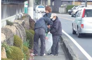
今回の珍ゴミ大賞は、なんと「パンパー」…(汗)