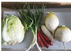
会社の畑や会長の畑で作った野菜を使って